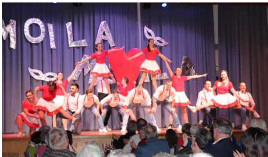
© Alejandra Ortiz - Christian Artner - Leopold Aigner