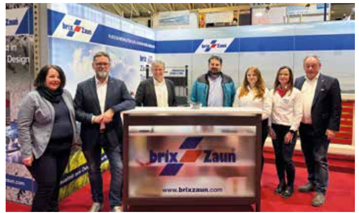
Brix Zaun präsentierte die Neuheiten bei Zäunen, Geländern und Sichtschutz